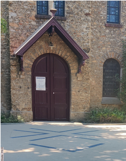
Le nouveau parvis du temple qui permet un accès sans contraintes, vue depuis le portail.

Le 15 septembre aura lieu l'« inauguration du temple rénové, clocher et parvis ». À tout seigneur tout honneur, la journée commencera par un culte inclusif. Avec le pasteur Apel, aumônier de la Fondation John Bost, nous soulignerons l'accueil signifié par ce nouveau parvis. En effet, il permet à des personnes en fauteuil de pouvoir entrer seules dans le temple. Mais la liturgie sera aussi adaptée, car si les lieux permettent l'accueil, il faut aussi que ce qui s'y passe en tienne compte. Sans doute des résidents de la Maison d'accueil spécialisée du « Grand Saule » de Montfermeil seront aussi présents.