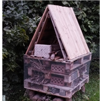
L'hôtel à insectes dans le jardin du temple.